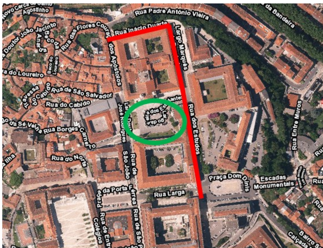
Imagem 3 – Alterações de trânsito.