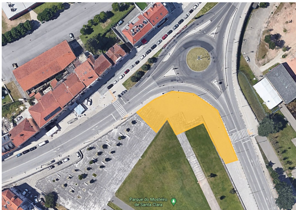
Imagem 2: A amarelo a venda permitida pelo número 3 acima referido.