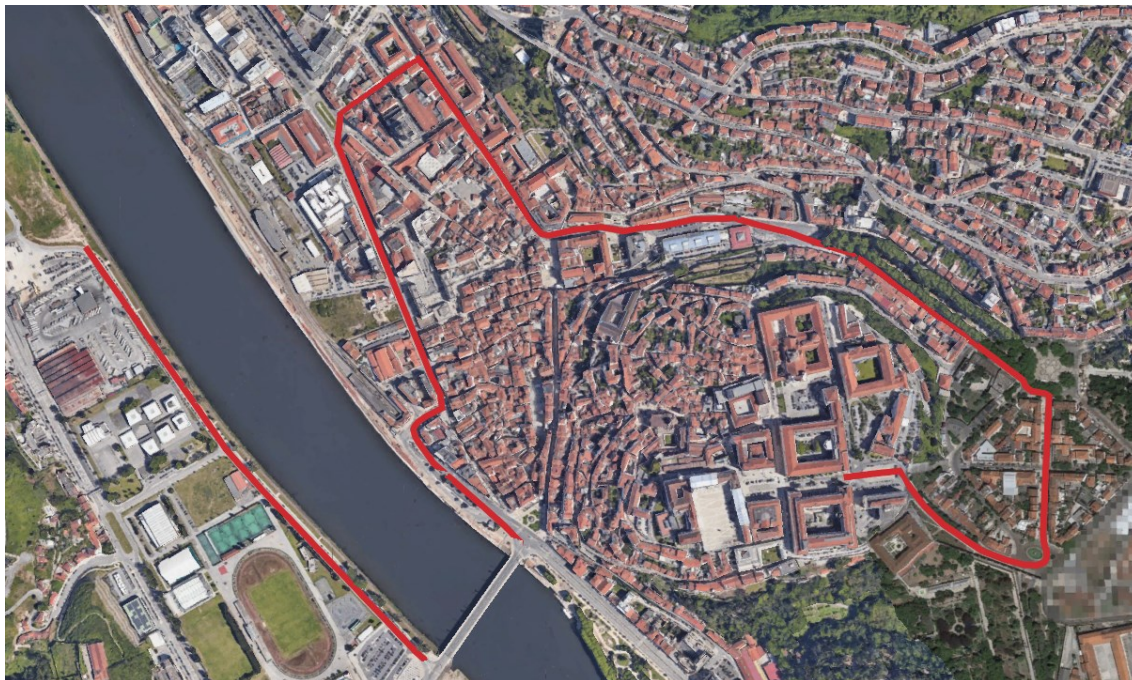
Imagem 1: Trajeto do “Cortejo dos Fitados” – 23/05/2023.

No dia 23/05/2023 , no período entre as 08h00 e o final do evento, que se prevê às 23h00, os estabelecimentos, de restauração e/ou bebidas, da zona seguinte, por razões de segurança relacionadas com o normal decorrer do “Cortejo dos Fitados” têm as licenças, autorizações ou meras comunicações prévias para ocupação do espaço público, suspensas nos termos do artigo 35.º do Regulamento Municipal de Ocupação de Espaço Público, Publicidade e Propaganda - RMOEPPP, Regulamento n.º 854/2021, de 13 de setembro, devendo remover do espaço público, todo o mobiliário de apoio ao estabelecimento: