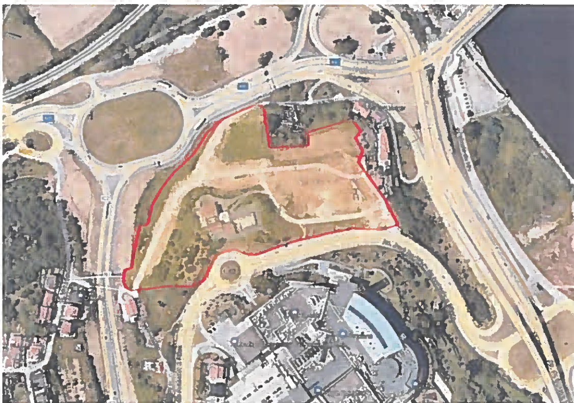
Raposa – Santa Clara