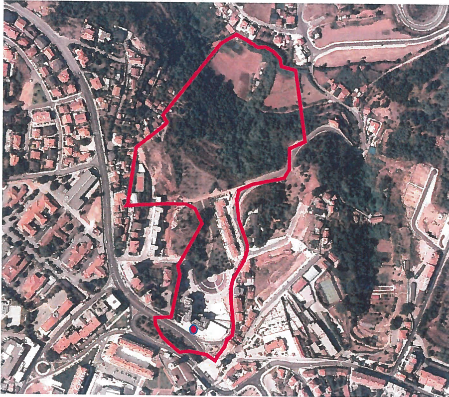
Lotes 2 e 3

Para o efeito proceder-se-á à notificação dos proprietários/titulares dos lotes/frações através de Aviso publicado em jornal local, bem como pelo presente Edital a afixar no Átrio dos Paços do Município, na sede da Freguesia de Santo António dos Olivais e no local da pretensão, sendo também divulgado no sítio da Internet do Município de Coimbra, em www.cm-coimbra.pt . Proceder-se-á ainda à notificação dos proprietários/titulares dos lotes/frações por carta registada.