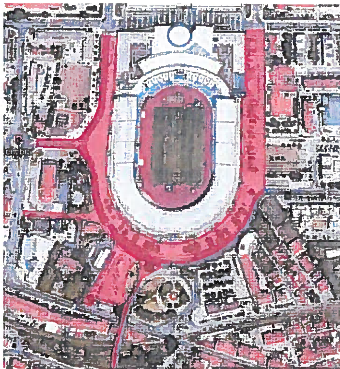
Legenda: Zona Vermelha – Perímetro de Segurança - Condicionantes